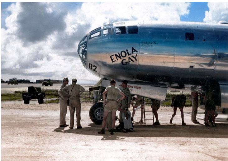
L'avion B29 Enola Gay, à la veille de sa mission sur Hiroshima