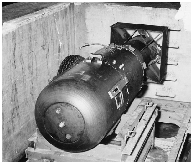
Little Boy avant son largage sur Hiroshima