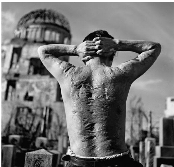
Les effets de la bombe sur le corps humain à Hiroshima

Hiroshima rasée par la bombe atomique. Au centre, le dôme de Genbaku (Palais des expositions industrielles). Conservé en l'état, il est aujourd'hui devenu le Mémorial de la paix d'Hiroshima et a été inscrit sur la liste du patrimoine mondial de l'UNESCO