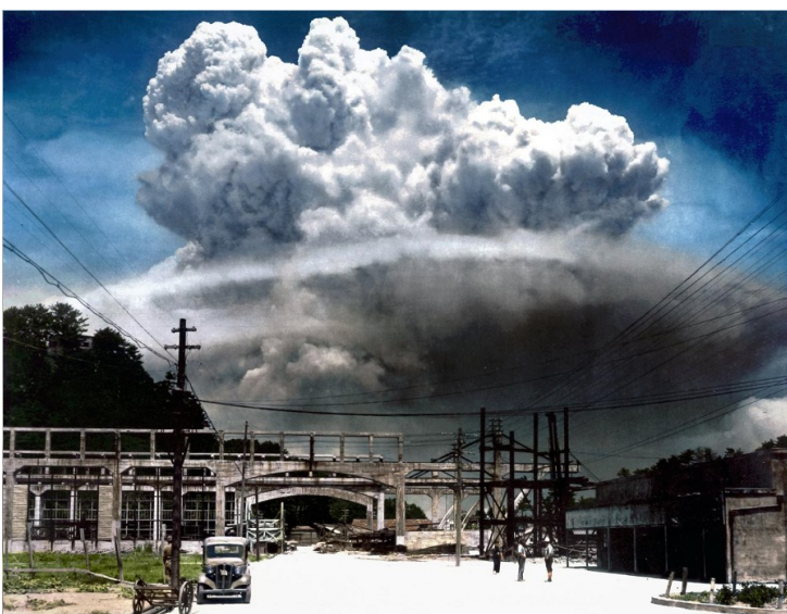
Le champignon atomique de Nagasaki photographié à une distance de 10 kilomètre le 9 août 1945