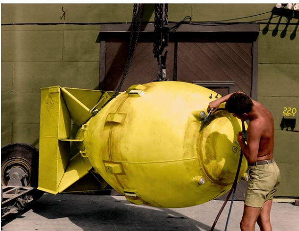
Fat Man avant son largage sur Nagasaki