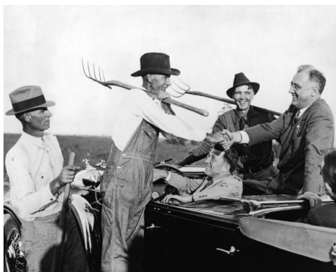
Roosevelt serrant la main d'un agriculteur près de Warm Spring en Géorgie, pendant la campagne présidentielle de 1932