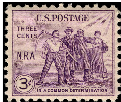
« Dans une commune détermination » Timbre appelant à l'union de toutes les composantes de la société pour affronter la crise (paysans, entrepreneurs, ouvriers et femmes seules).