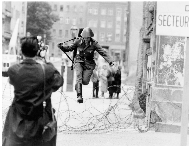
Une image qui emblématique, le vopo est-allemand Conrad Schumann s'élançait en direction du monde libre

« Si cruel et illégal qu'il soit, le geste communiste de fermeture de la frontière avec Berlin-Ouest était inévitable. L'exode des réfugiés dépeuplait l'Allemagne orientale : un quart de la population du pays avait fui à l'Ouest depuis 1945. Cette condamnation quotidienne du régime dépassait ce que MM. Khroutchchev et Ulbricht pouvaient tolérer. »