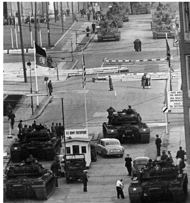
Checkpoint Charlie, le point de passage le plus célèbre entre le secteur américain et le secteur soviétique

1. Walter Ulbricht, chef du parti communiste est-allemand (1950-1971), chef de l'État de la RDA de 1960 à 1973.