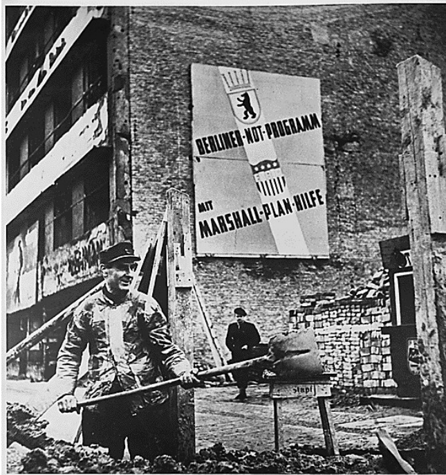
Grâce au plan Marshall, Berlin-Ouest est, en quelques années, devenue la vitrine du capitalisme et de la démocratie au cœur du glacis soviétique