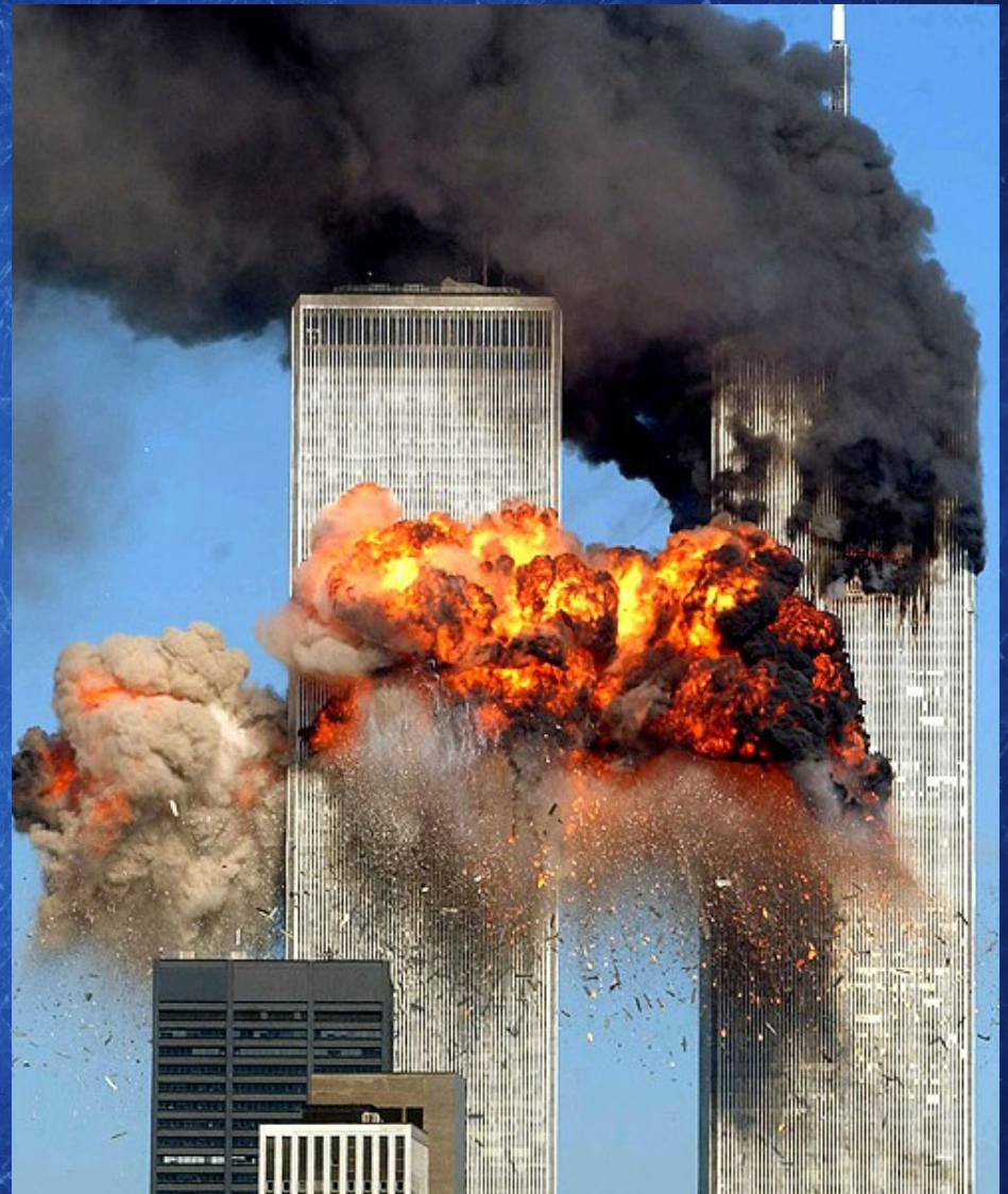
Les tours jumelles du World Trade Center cibles des attentats du 11 septembre 2001