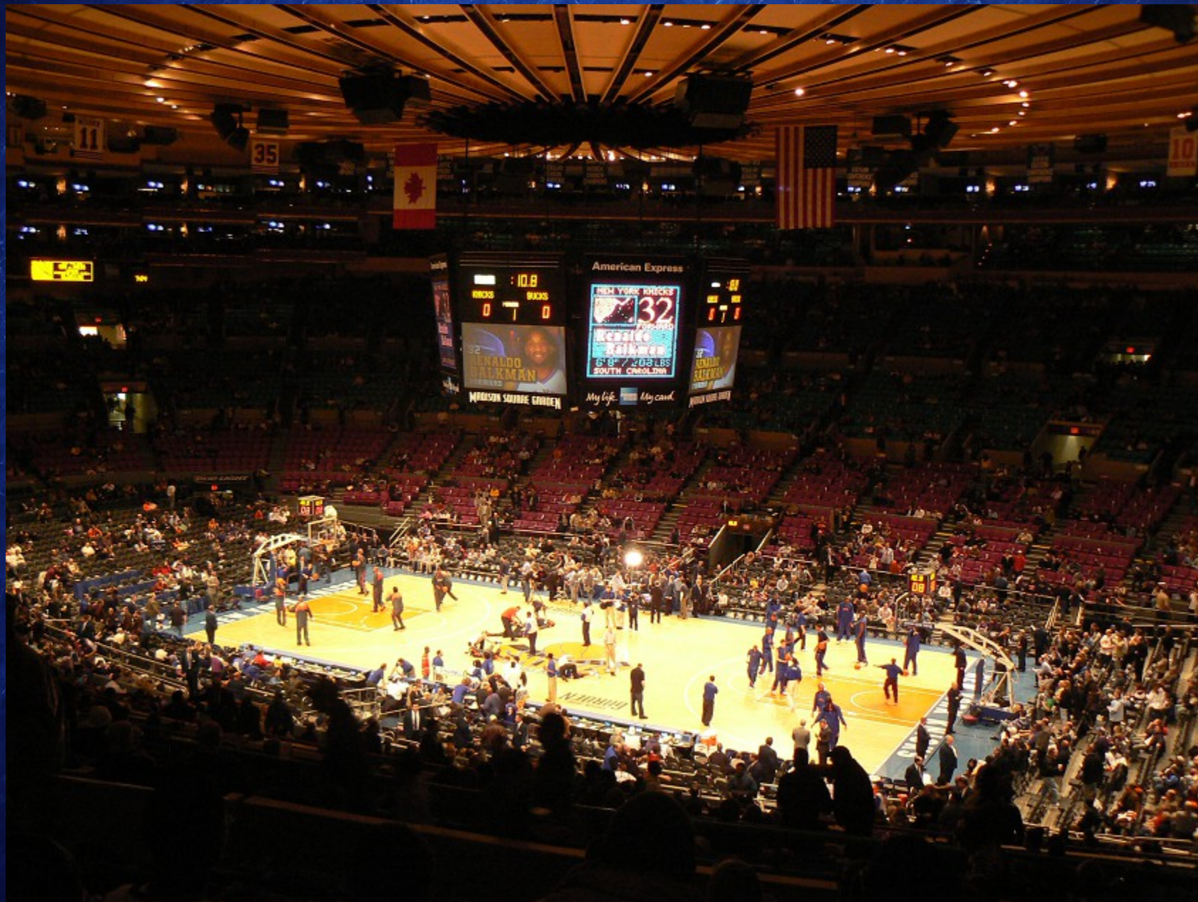
Intérieur du Madison Square Garden