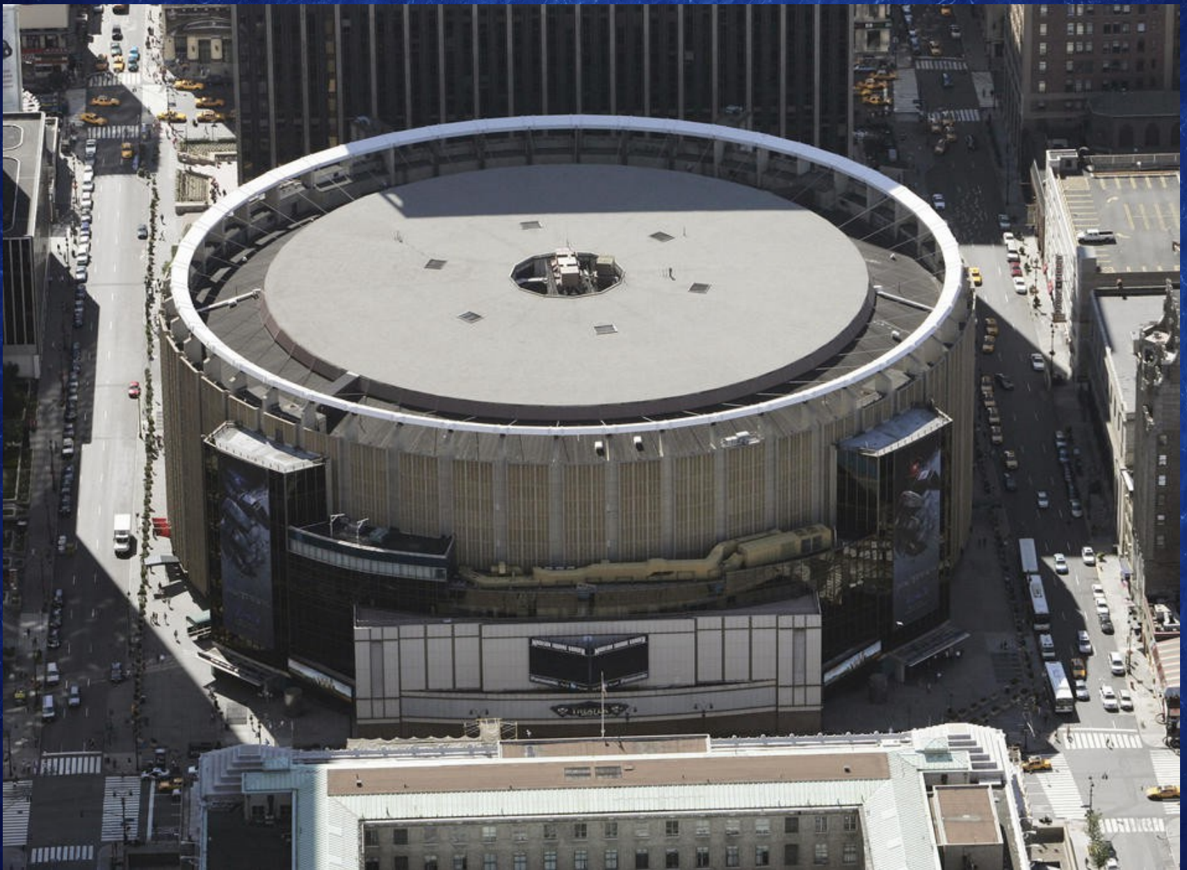
Madison Square Garden