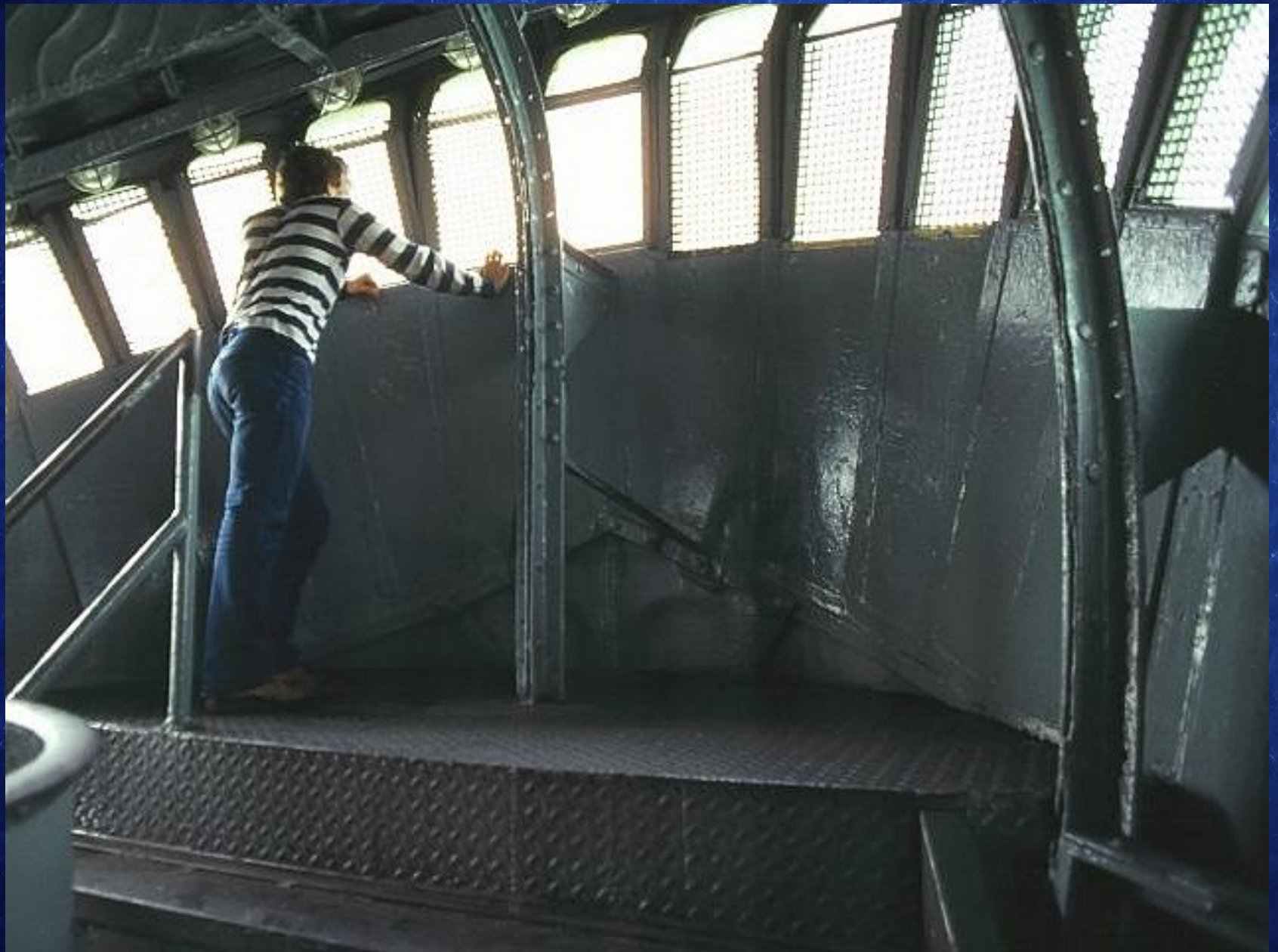
Intérieur de la tête de la statue de la Liberté