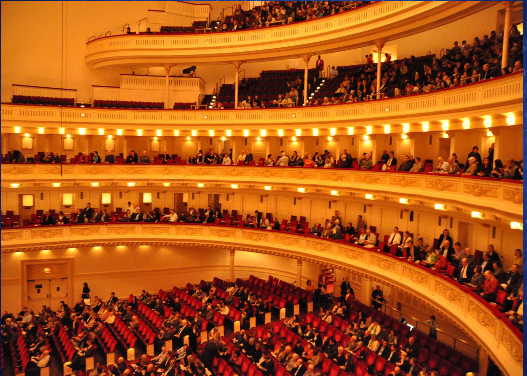
Intérieur du Carnegie Hall