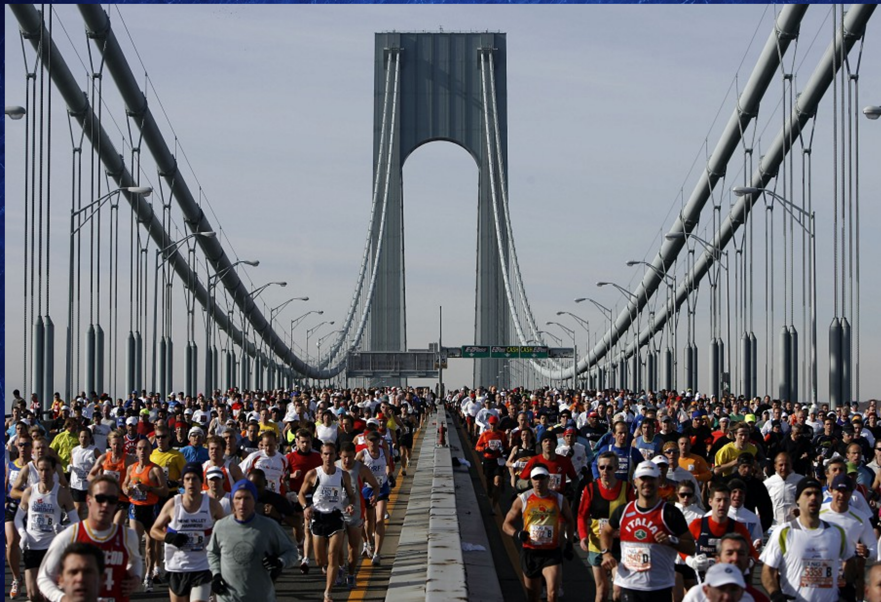
Pont Verrazzano lors du Marathon de New York