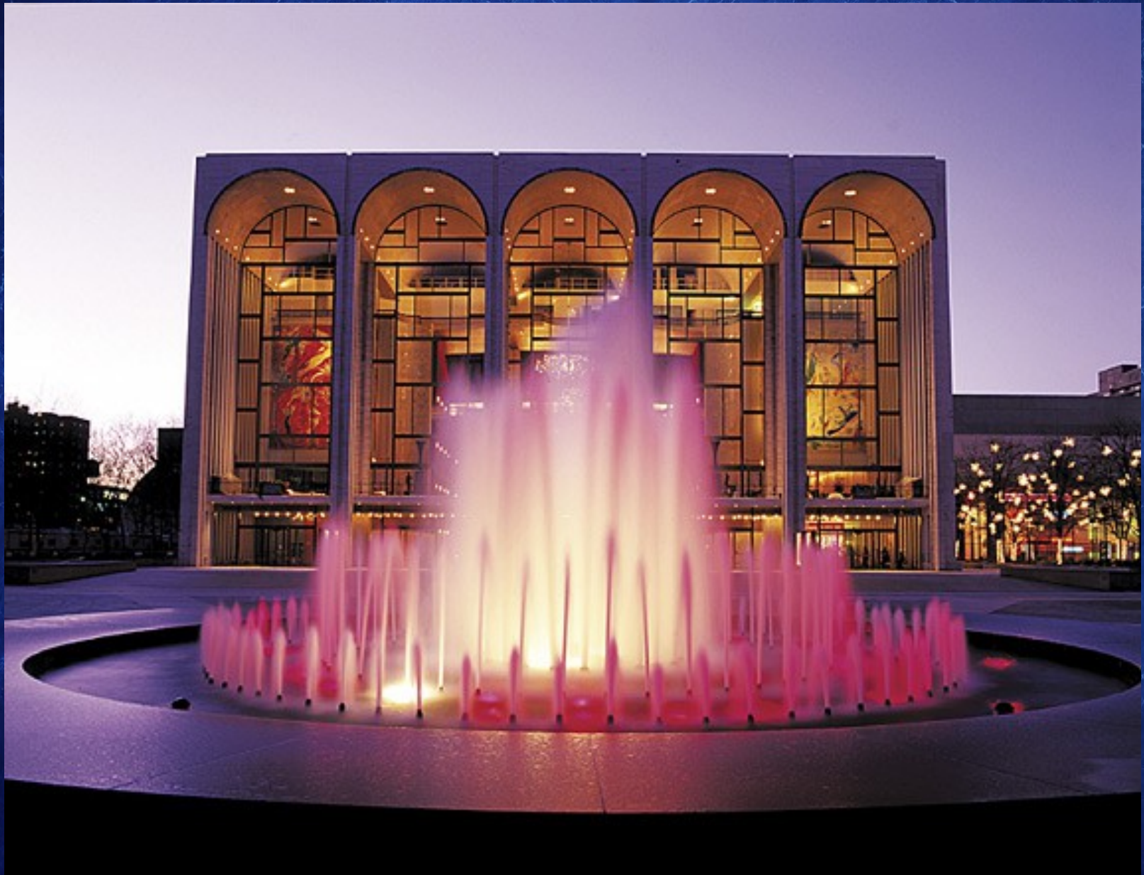
Bâtiment central du Lincoln Center