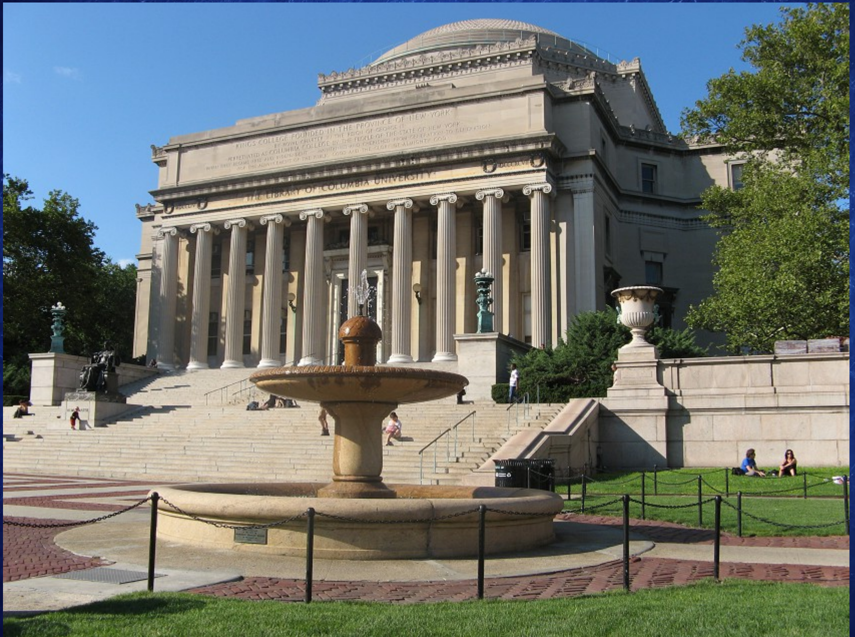
Université de Columbia