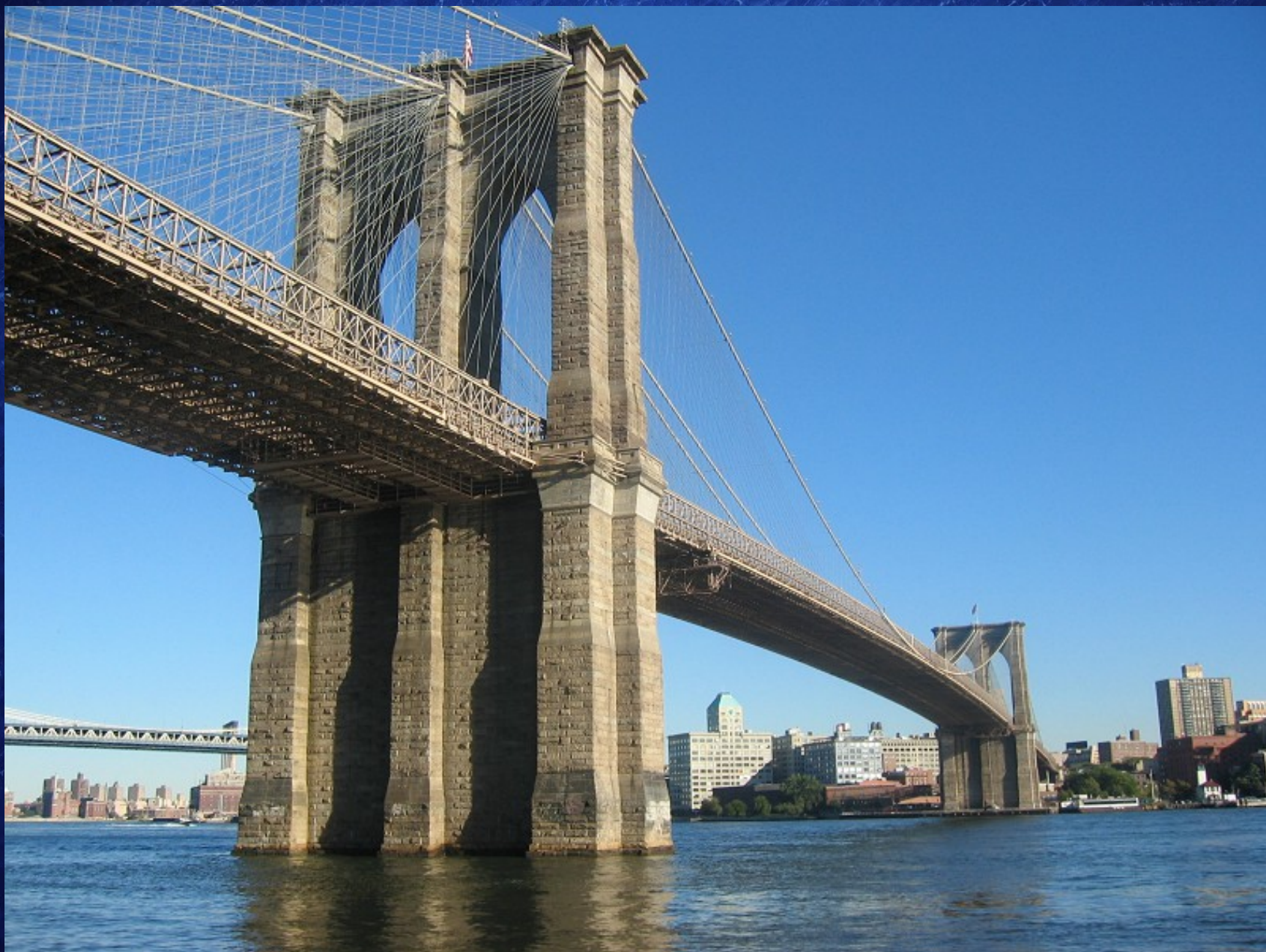
Pont de Brooklyn