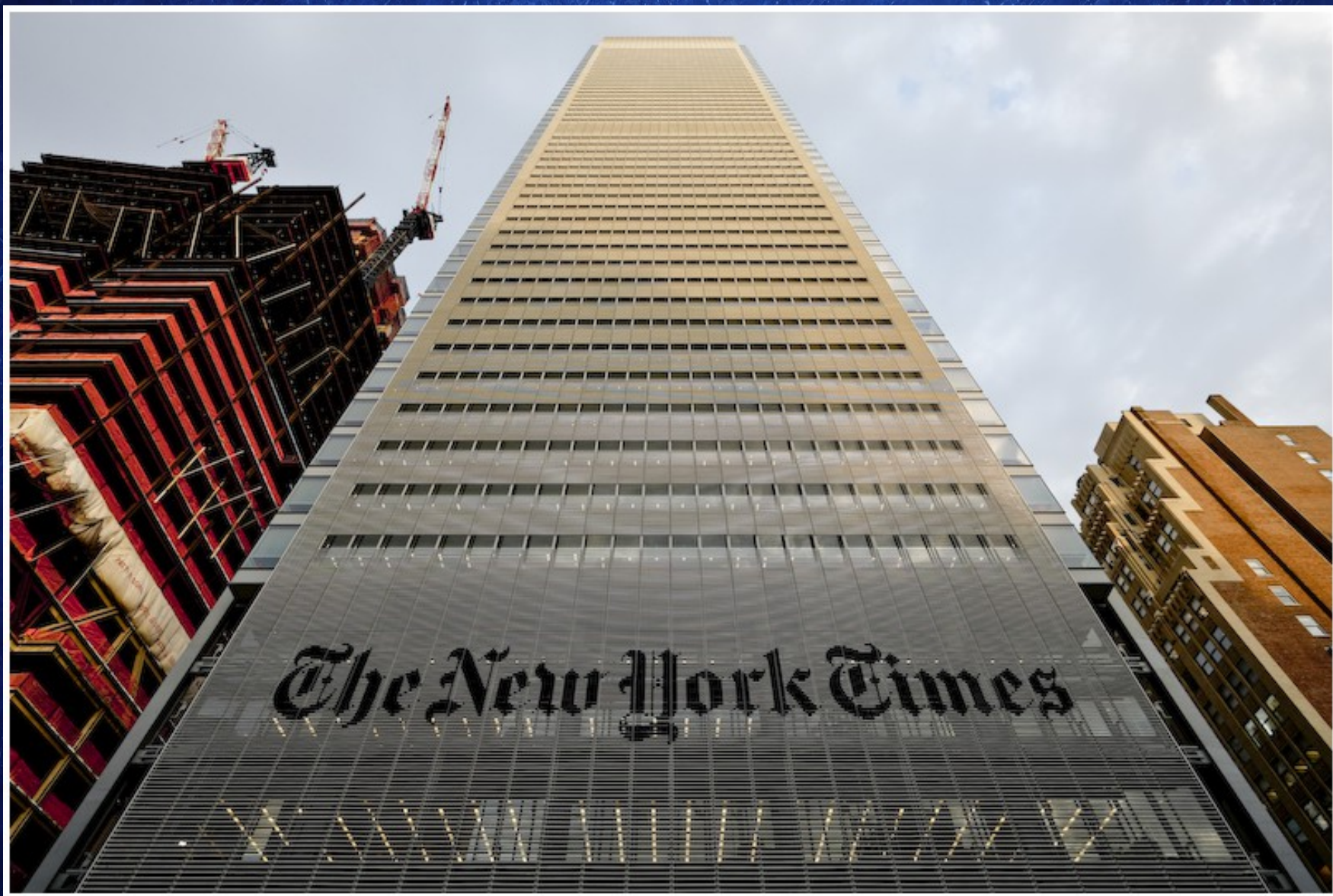
Siège du New York Times