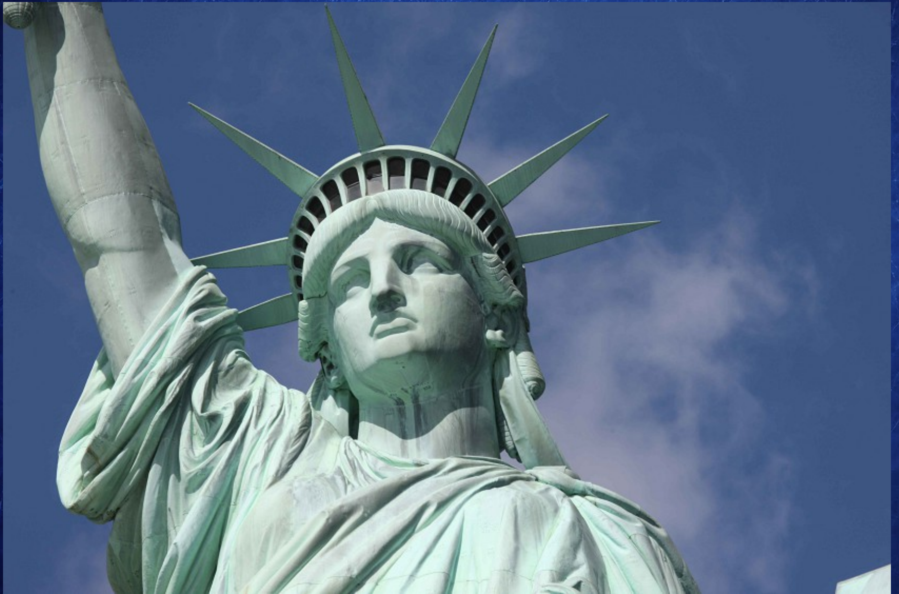
Statue de la Liberté