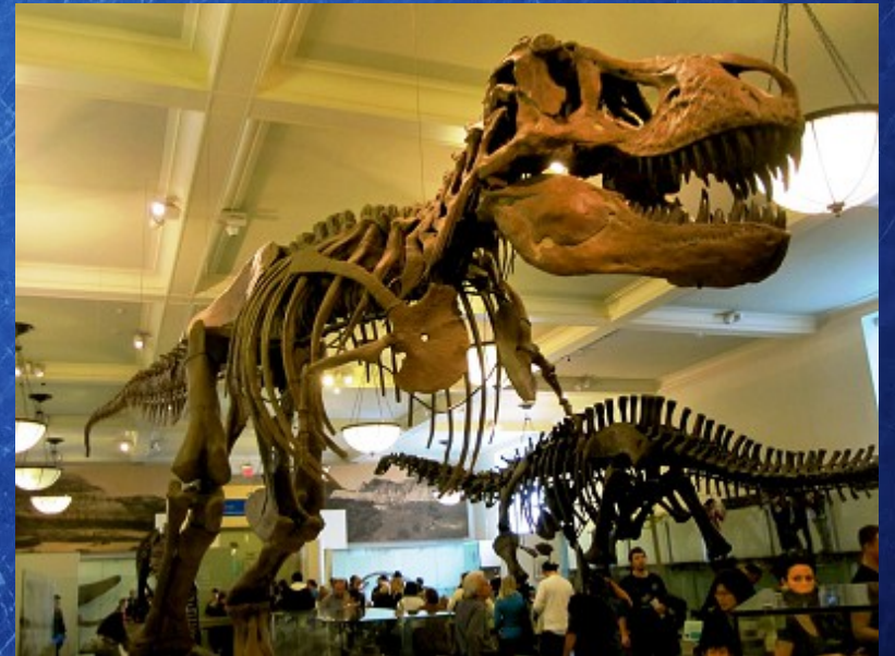
Musée d'histoire naturelle