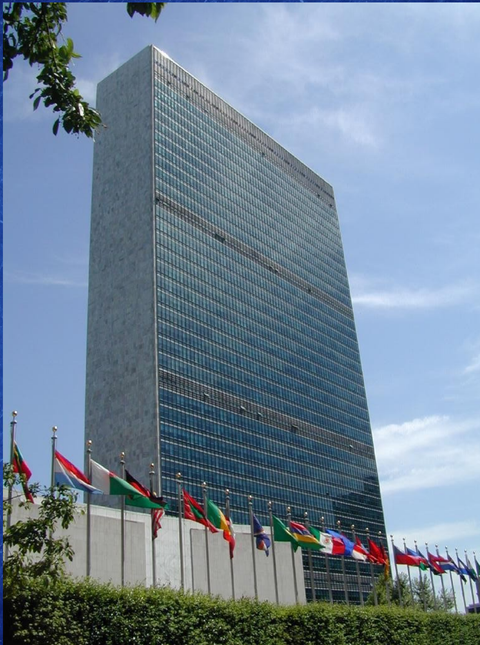
Siège de l'ONU, le long de l'East River