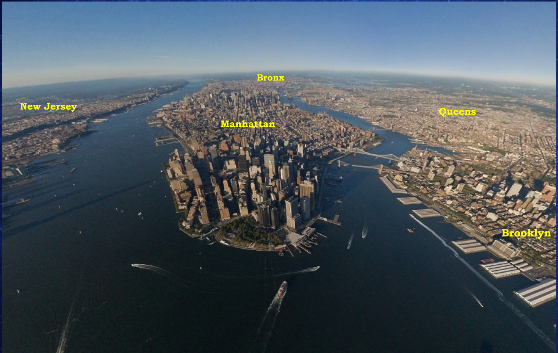
Vue aérienne de Manhattan