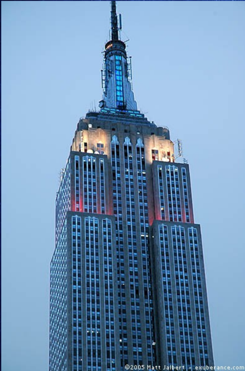
Empire State Building