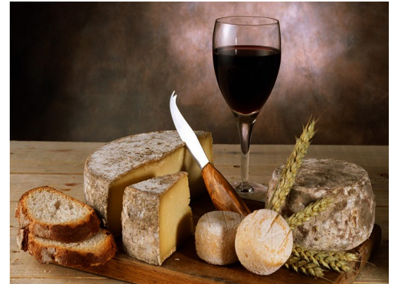
Gastronomie : le pays du vin et du fromage