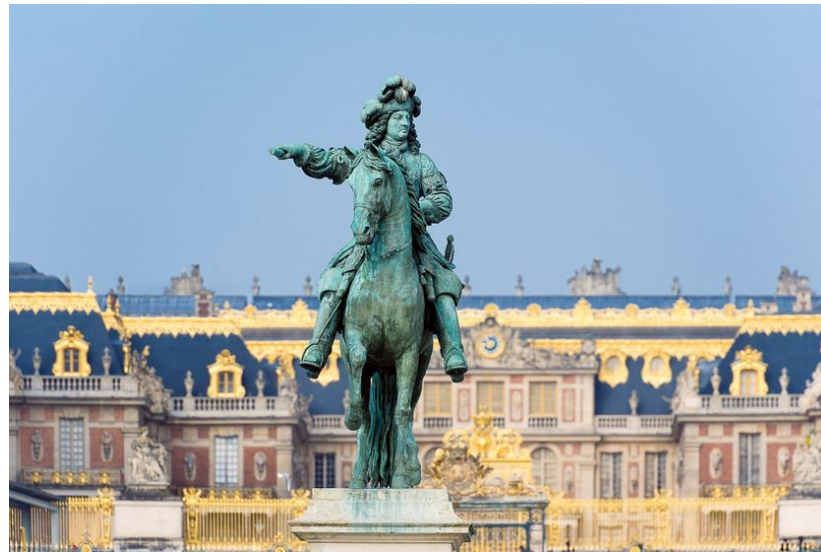
Sculpture : statue équestre de Louis XIV à Versailles