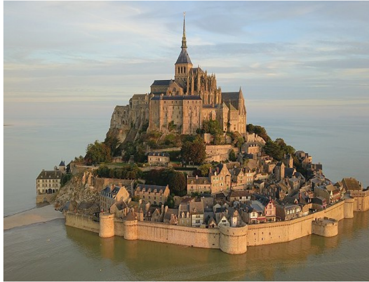
Un grand site naturel, le Mont-Saint-Michel