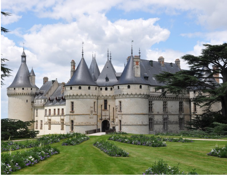
Architecture : Le château de Chaumont