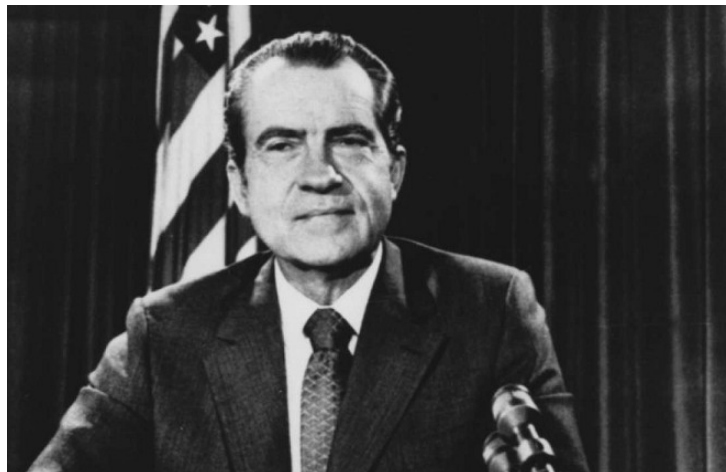
Le président américain Richard Nixon annonçant la fin de la convertibilité du dollar en or le 15 août 1971. Le système de Bretton Woods s'effondre.