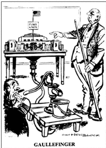
De Gaulle réclamant au Trésor américain la conversion des dollars détenus par la France en or. Dessin de Herblock.