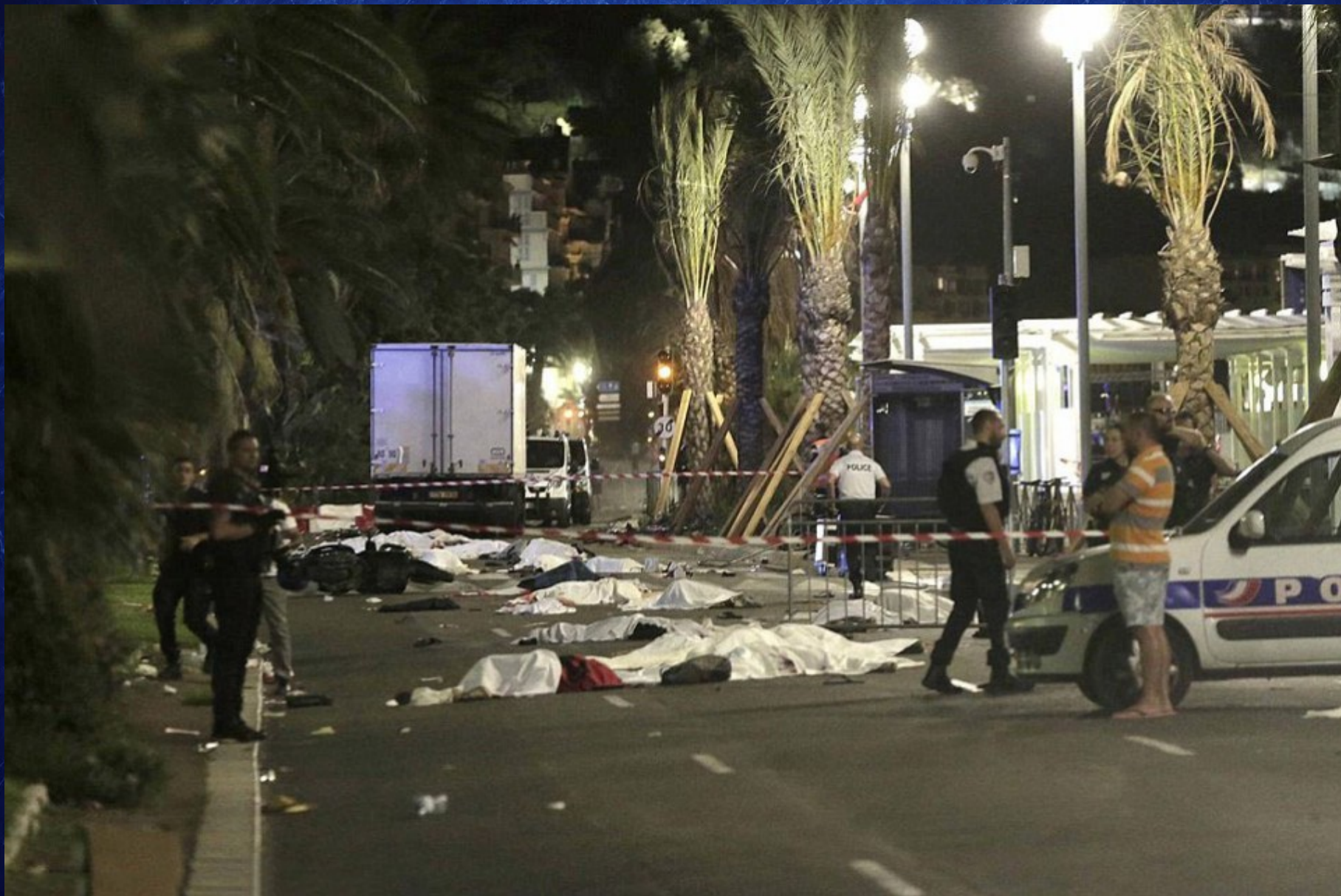
Attentat de Nice, 14 juillet 2016 - 86 morts écrasés par un camion