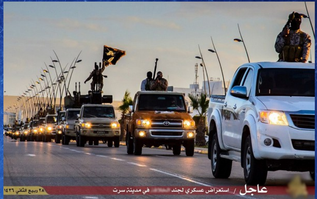
Parade militaire à Raqqa en 2014