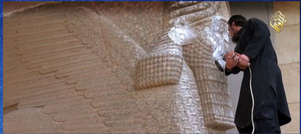
Un taureau ailé assyrien défiguré au marteau perforateur sur le site archéologique de la porte de Nergal à Ninive