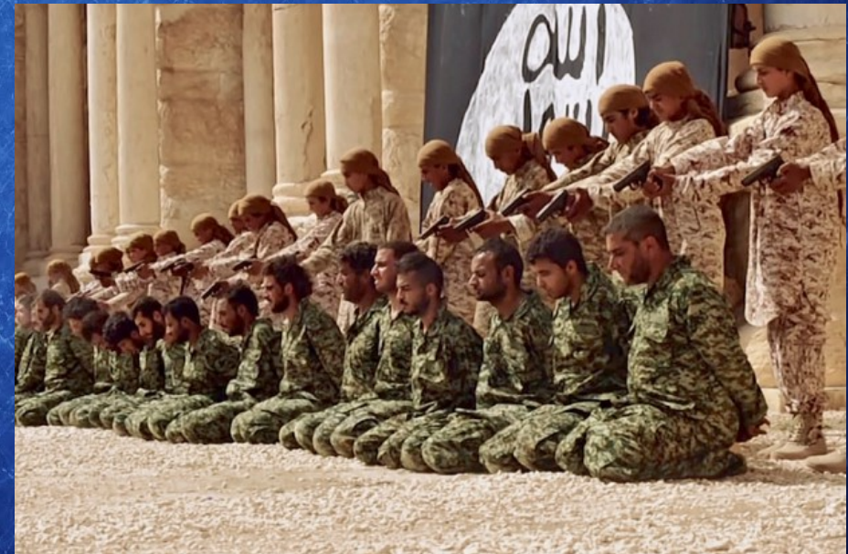
Exécution de masse dans le théâtre antique de Palmyre