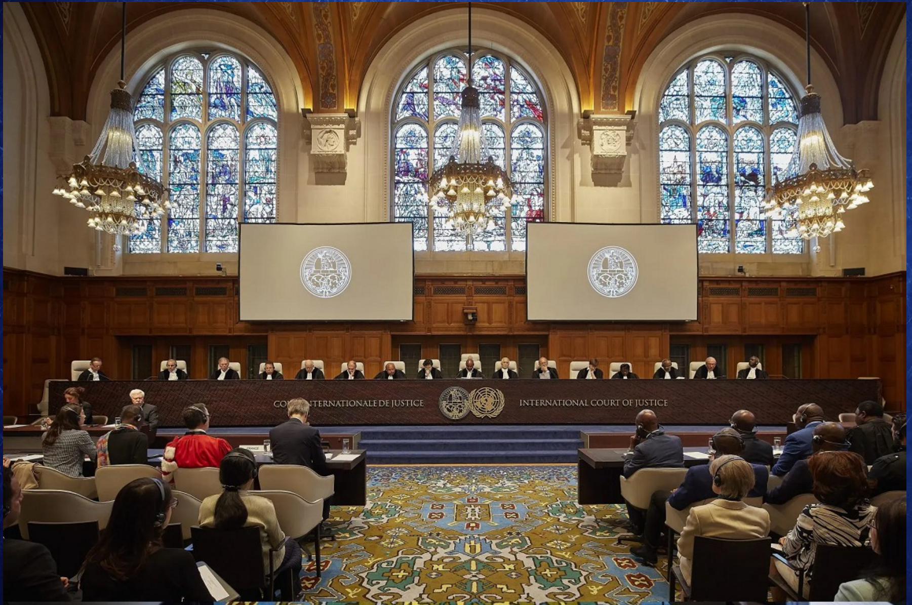
La Cour internationale de Justice de La Haye aux Pays-Bas