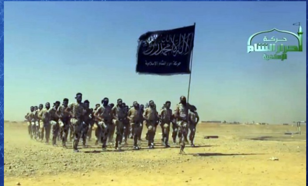
Camp d'entraînement djihadiste dans la zone syro-irakienne