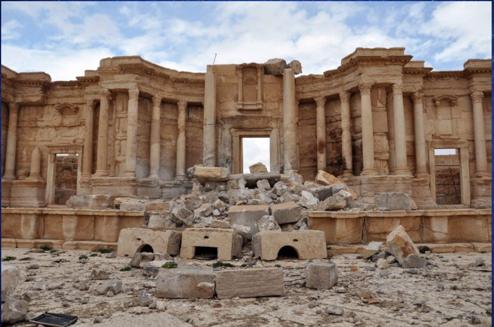
Le théâtre de Palmyre en Syrie après la passage de l'État islamique, photo prise le 3 mars 2017