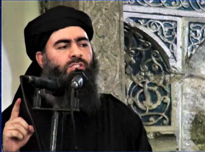
Le « calife » autoproclamé Abu Bakr al Baghdadi