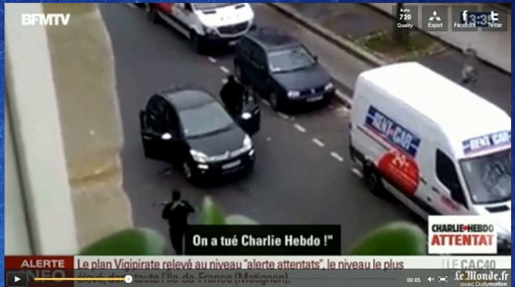
Attentat contre Charlie Hebdo, janvier 2015 - 12 morts