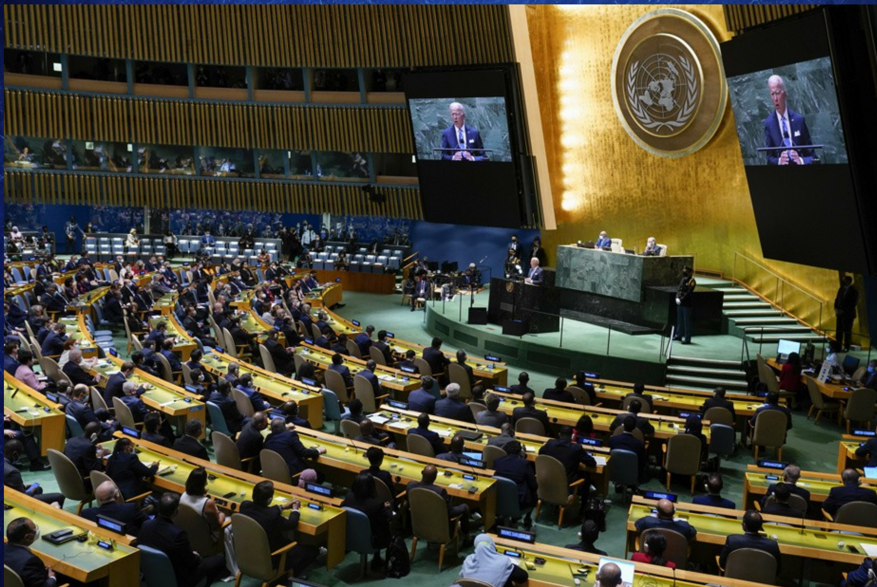
Le président américain Joe Biden à l'assemblée générale de l'ONU le 21 septembre 2021