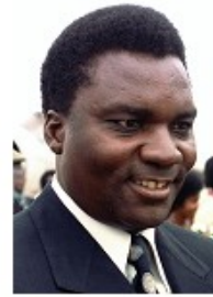
Le président hutu Juvénal Habyarimana

Le FPR prend Ruhengeri et Gisenyi. Fin de la guerre.