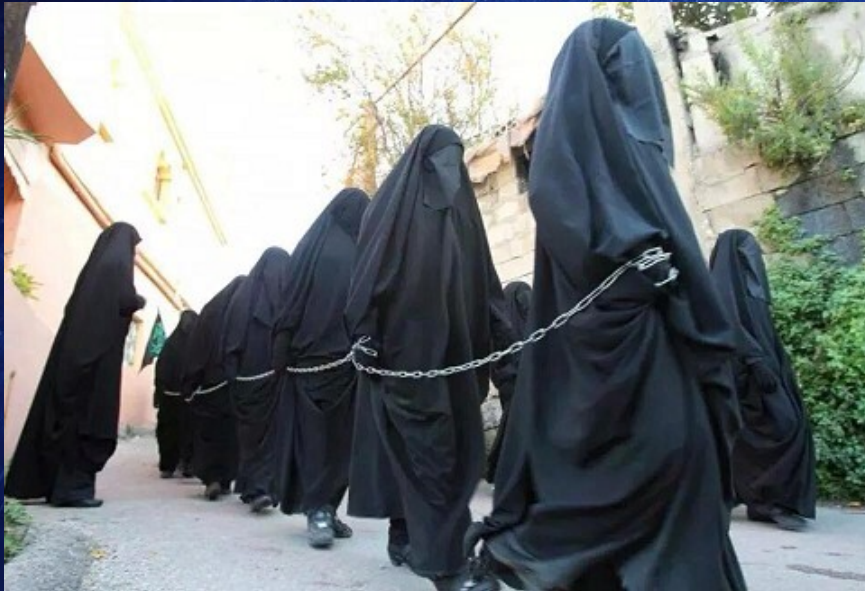
Femmes réduites en esclavage