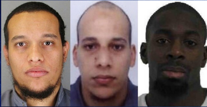
Les frères Kouachi et Coulibaly