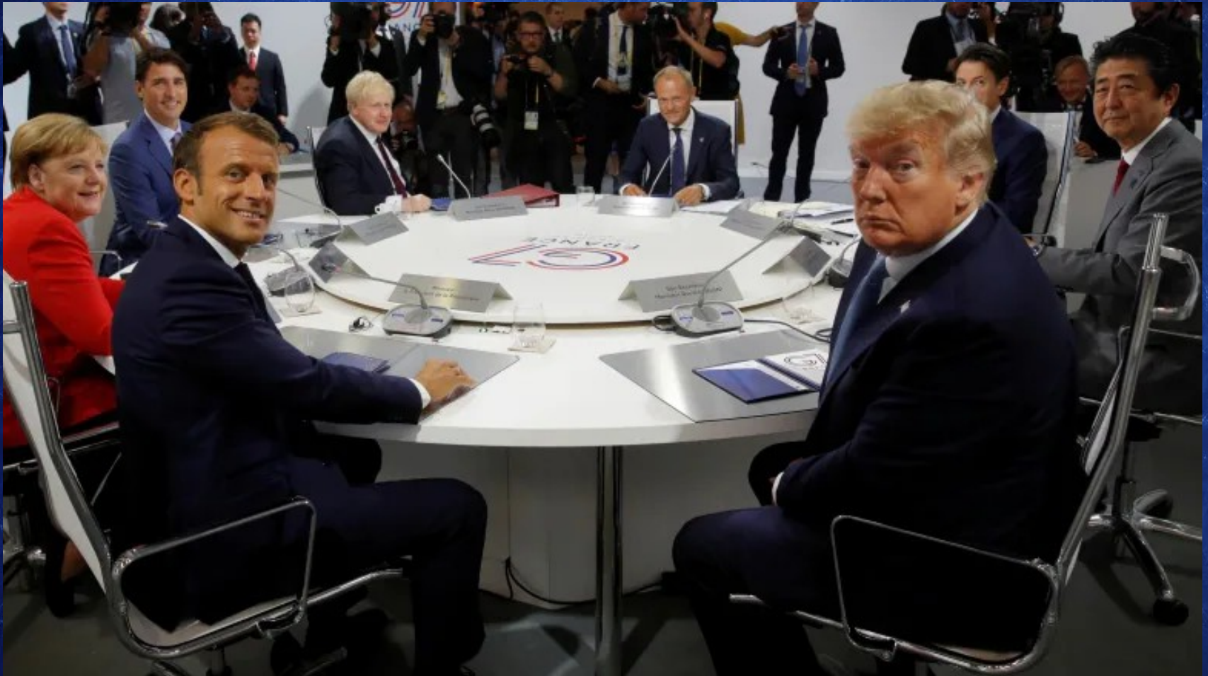
Sommet du G7 à Biarritz en 2019