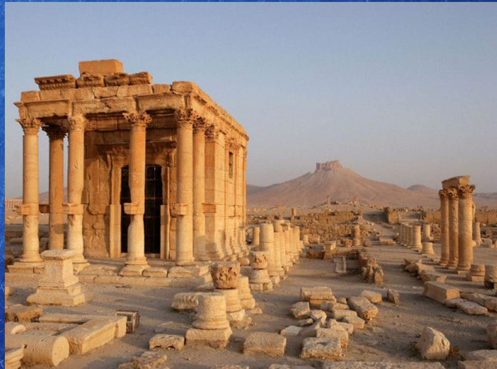
Le temple de Baal à Palmyre avant sa destruction à l'explosif