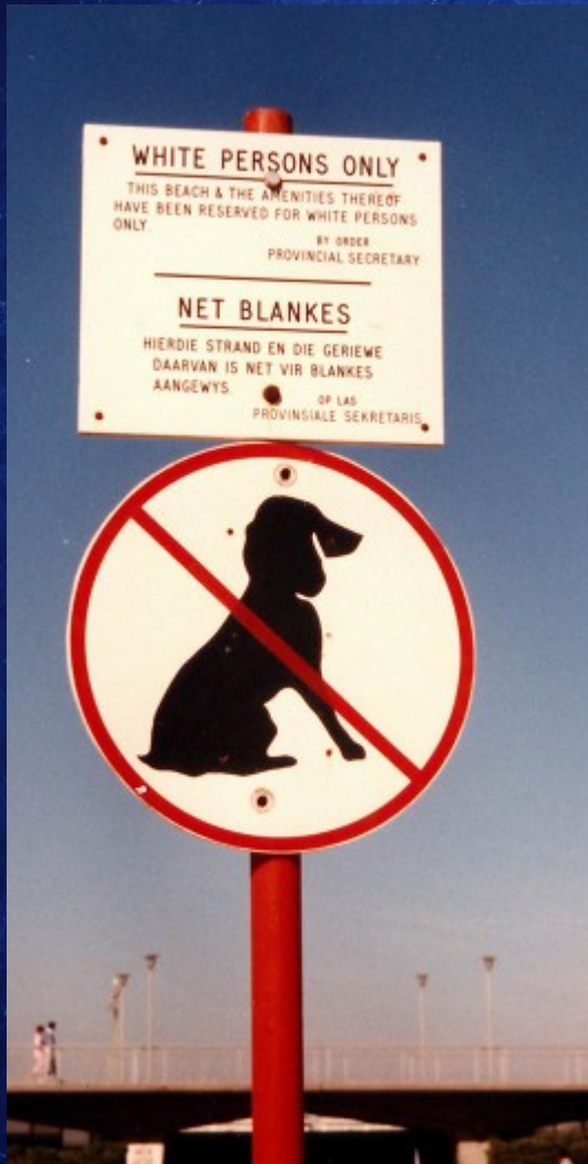
Panneau de signalisation interdisant aux hommes de couleurs et aux chiens l'accès à une plage en Afrique du Sud 1985