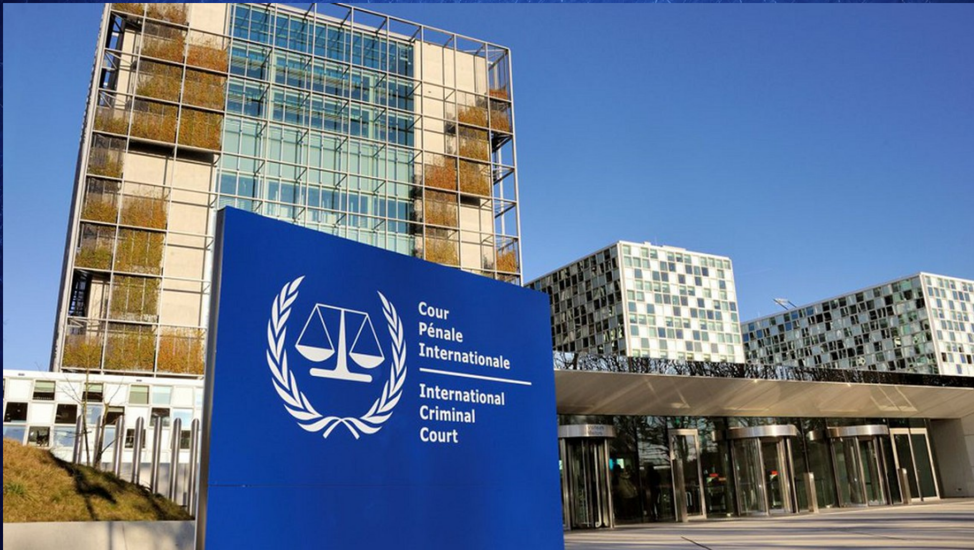
La Cour pénale internationale de La Haye aux Pays-Bas