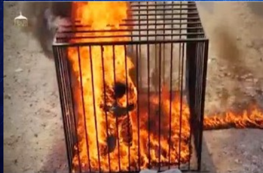
Pilote syrien brûlé vif dans une cage