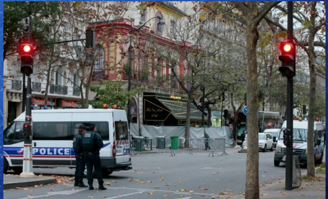
Attentat de Paris, novembre 2015 (Bataclan) - 89 morts