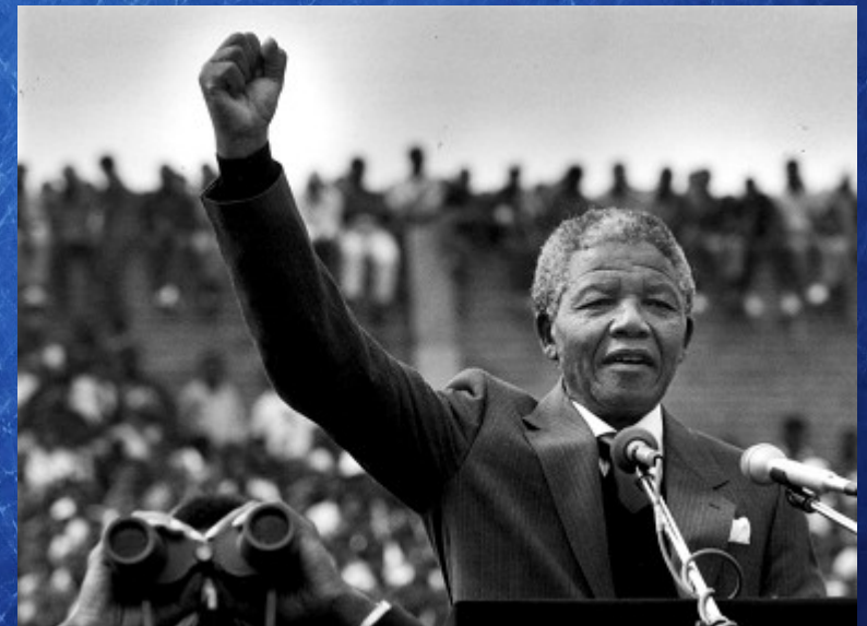
Nelson Mandela, dans le stade de Soweto à Johannesburg, devant 200 000 personnes deux jours après sa libération le 13 février 1990