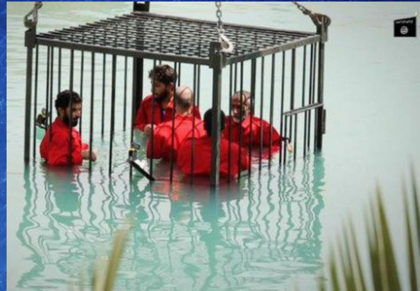
Noyades à Palmyre