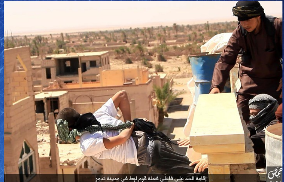
إقامة الحد على فاعلي فعلة قوم لوط في مدينة تدمر