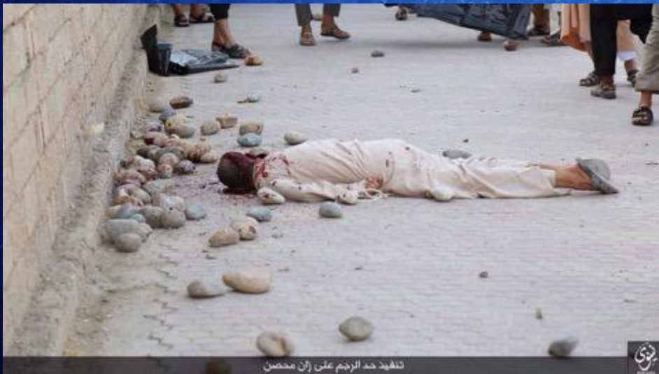
تنفيذ حد الرجم على إبان محصن