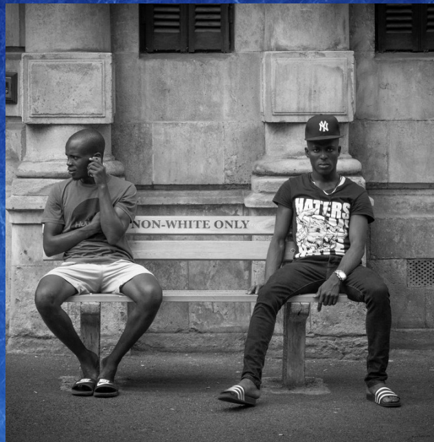
Banc public réservé aux hommes de couleurs (Noirs, Indiens, métis...)