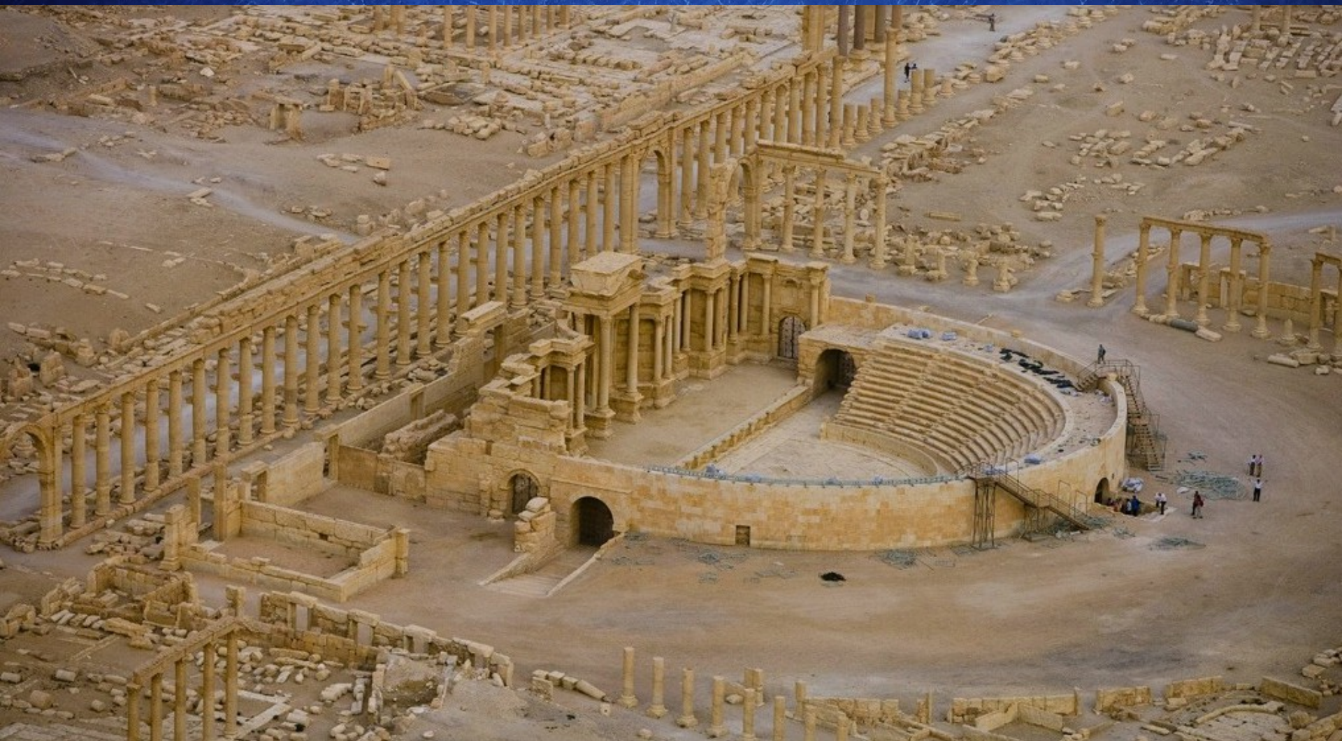
Le théâtre de Palmyre avant sa dégradation par l'État islamique en 2016