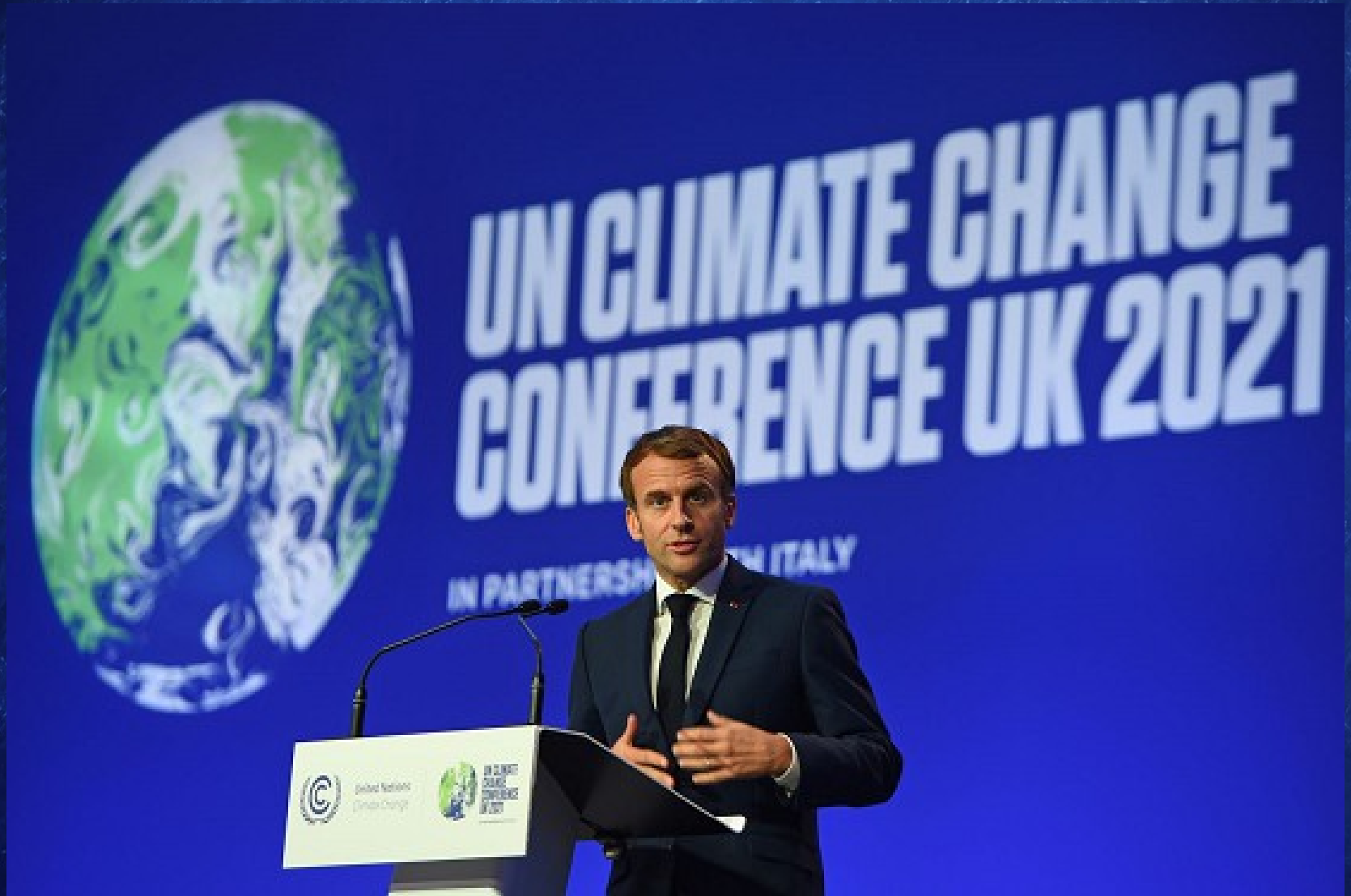
Le président français Emmanuel Macron à la COP 27 de Glasgow en Écosse le 1 er novembre 2021