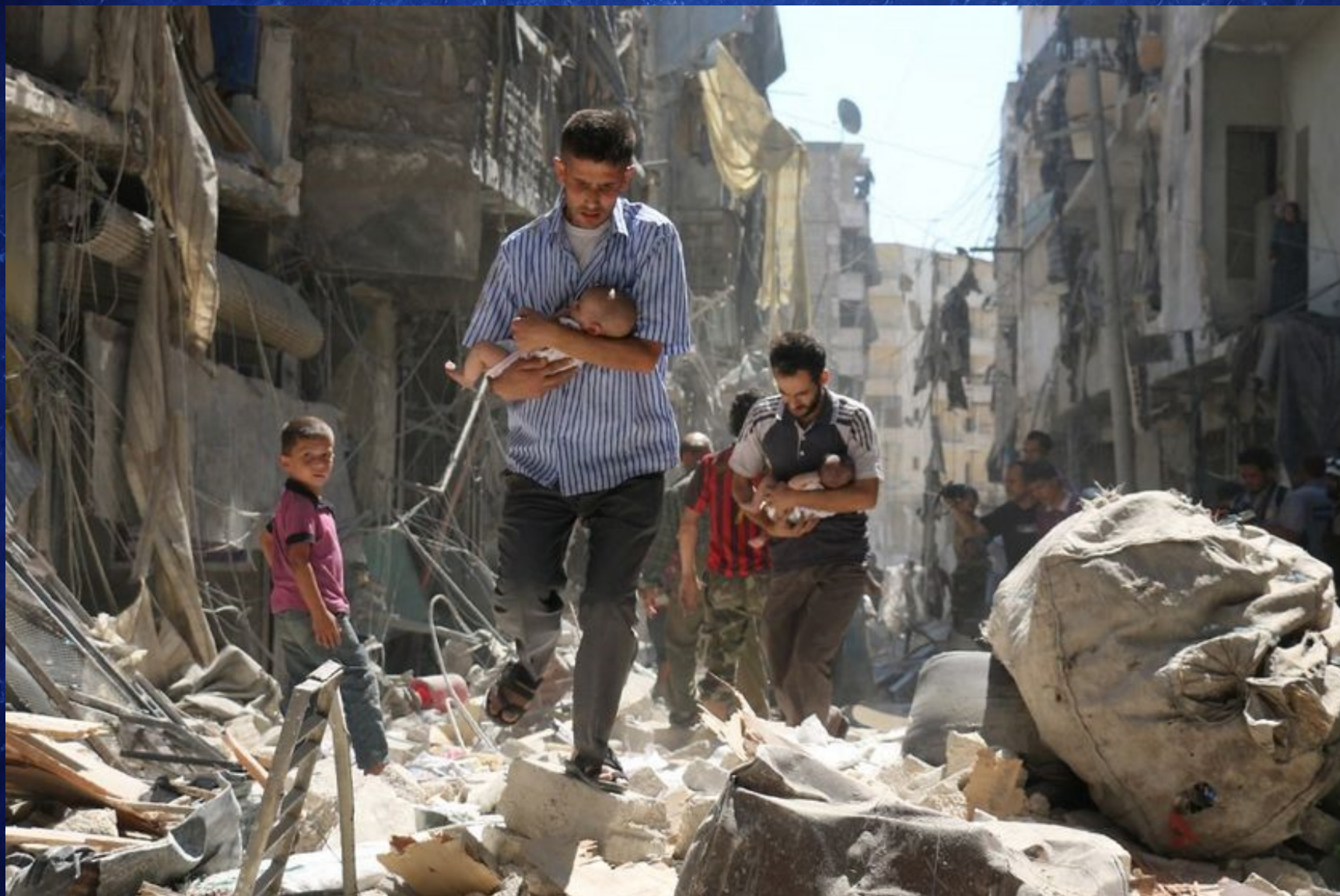
Scène de guerre en Syrie