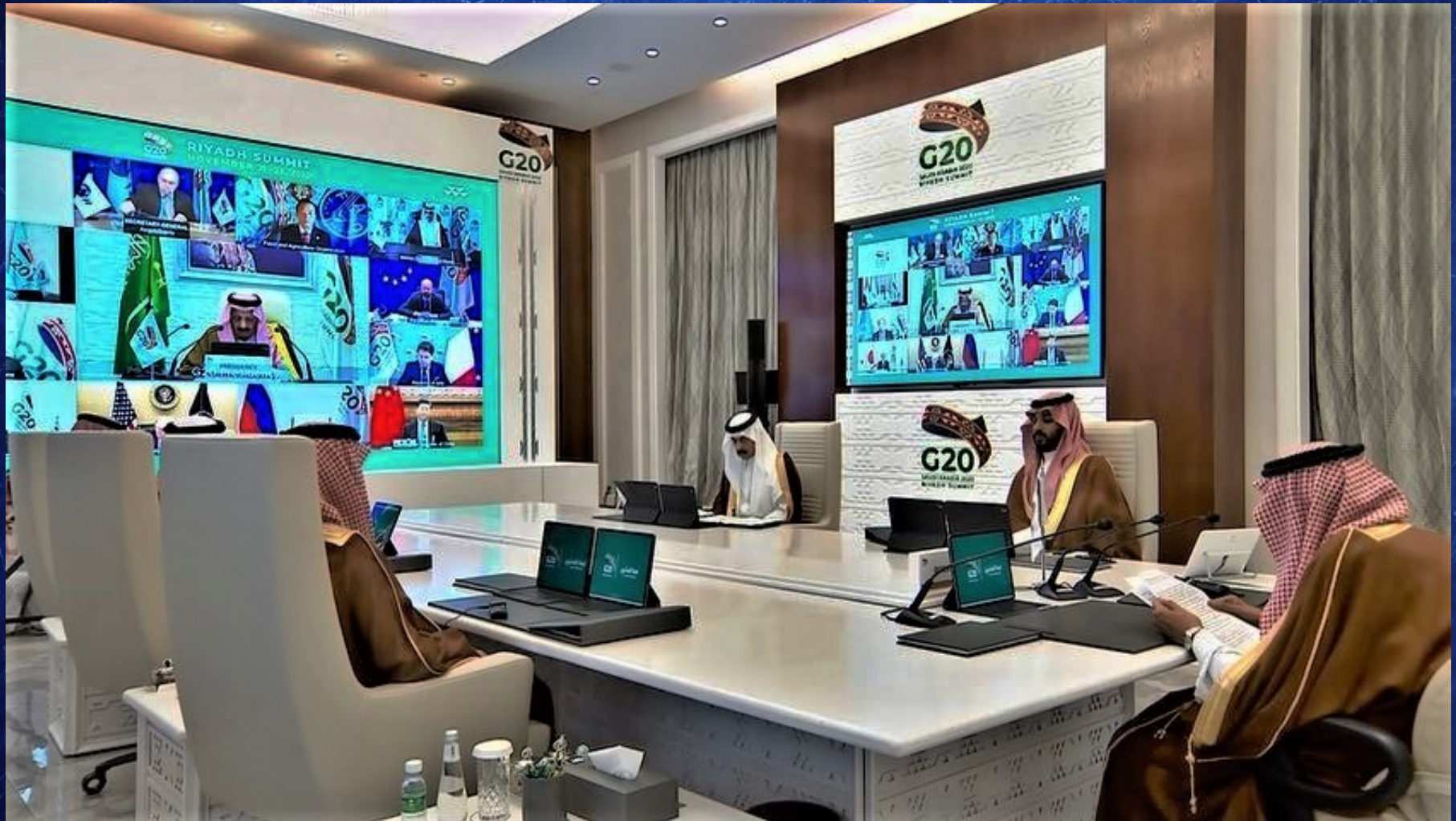
Sommet virtuel du G 20 organisé par l'Arabie saoudite en 2020, lors de l'épidémie de Covid 19